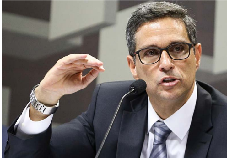
Roberto Campos Neto, presidente do Banco Central, discorrendo de Lula quanto à meta fiscal

A afirmação do presidente do BC vem logo depois de Lula afirmar que “a meta fiscal não precisa ser zero”. A fala, como esperado, desagradou o mercado – e o próprio Campos Neto. O presidente do Banco Central afirmou, durante evento no dia 7, que “se não fizermos esforço para perseguir a meta, isso vai gerar prêmio de risco e